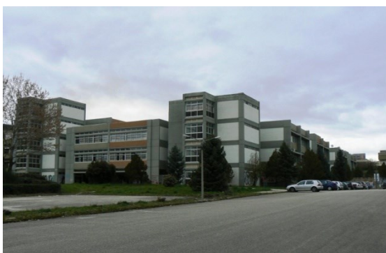
Εικόνα 1: Το κτήριο της Φιλοσοφικής Σχολής του Πανεπιστημίου Ιωαννίνων

Το Τμήμα Φιλολογίας συστεγάζεται μαζί με το Τμήμα Ιστορίας – Αρχαιολογίας στο κτήριο της Φιλοσοφικής Σχολής του Πανεπιστημίου Ιωαννίνων (βλ. Εικόνα 1).