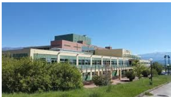
Εικόνα 3: Βιβλιοθήκη & Κέντρο Πληροφόρησης του Πανεπιστημίου Ιωαννίνων

Η βιβλιοθήκη του Πανεπιστημίου Ιωαννίνων ( https://lib.uoi.gr/ ) βρίσκεται σε ξεχωριστό κτήριο στην Πανεπιστημιούπολη Α΄ στα Ιωάννινα και φιλοξενεί έντυπο και ηλεκτρονικό υλικό από όλες τις επιστήμες που θεραπεύει το Πανεπιστήμιο Ιωαννίνων (βλ. Εικόνα 3).