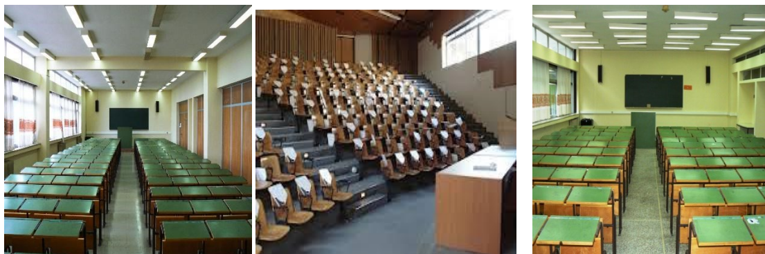
Εικόνα 2: Αίθουσες του Τμήματος Φιλολογίας του Πανεπιστημίου Ιωαννίνων

διαδραστικό πίνακα. Στο κτήριο διατίθεται ελεύθερη πρόσβαση στο διαδίκτυο μέσω ασύρματου δικτύου (Wi-Fi).